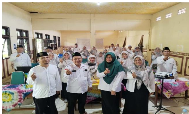
Gambar 3. Rapat Koordinasi dan Pelatihan Guru dalam Penguatan Kurikulum Nilai

Kelembagaan madrasah menunjukkan kesiapan moderat dalam mengintegrasikan Kurikulum Berbasis Cinta ke dalam sistem pendidikan. Hasil analisis dokumen menunjukkan adanya dukungan dari pimpinan madrasah berupa pelatihan guru, revisi RPP berbasis nilai, dan integrasi tema rahmah dalam visi-misi lembaga.