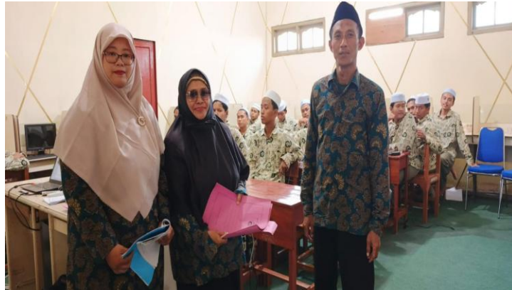
Gambar 1. Kegiatan Pembelajaran Reflektif dan Mentoring Spiritual di MA Riyadlus Sholihin