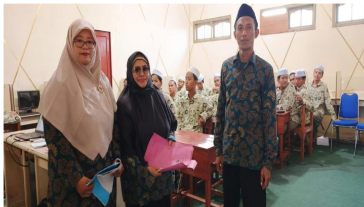
Gambar 2. Guru sebagai Murabbi dalam Lingkungan Pembelajaran Humanistik